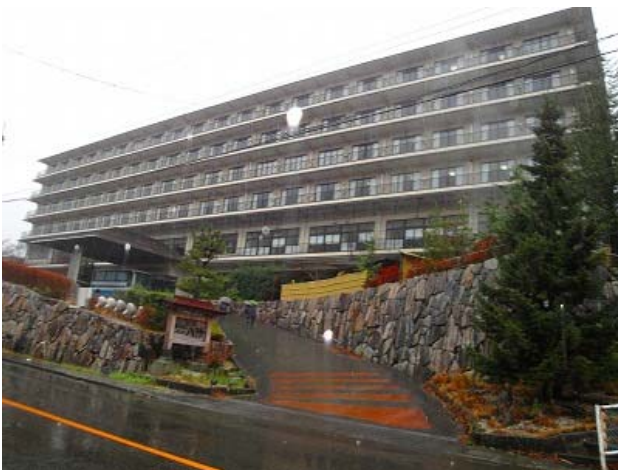
12:00 過ぎに、無事、全員ホテルニュー八汐に到着。 雄さんよりルームキーの配布、本日のスケジュール案内。