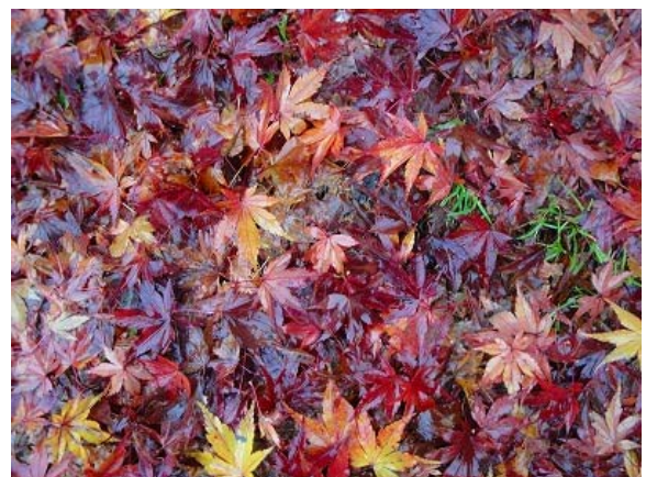
あいにくの雨で当初予定していた塩原散策は断念した が、道々、紅葉は真っ盛り。