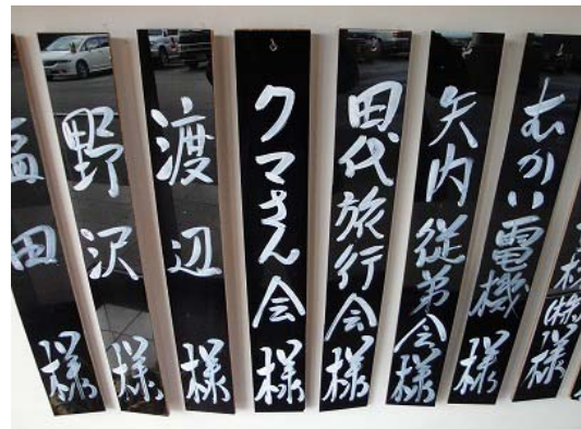
まずはお部屋に荷物をおいて、 12:20 ロビーに再集合して、昼食に出かける。