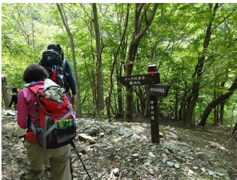
歩き始めて約 50 分、ゴラ沢出合の標識が出てきた。ゴラ沢はもう近い