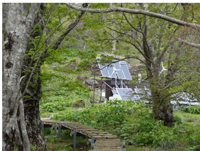
ソーラーパネルが見えればもうすぐ山頂だ。