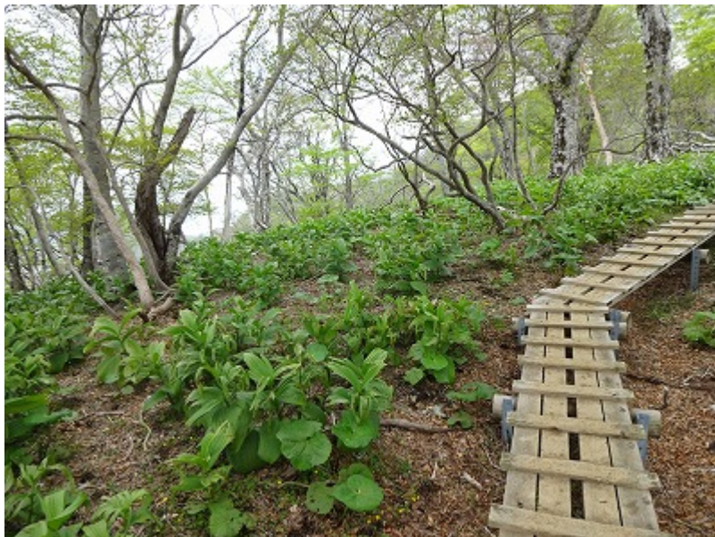
12:40 山頂間近になると木道になり、 周囲は一面コバイケソウの群生となる。 ブナの樹林帯だ。