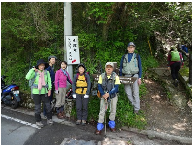
10 分ほど舗装道路歩いて、ツツジコースの登山道入口に到着（9:40）。 ここからいよいよ山道に入る。