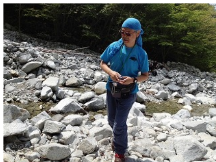
ゴーラ沢の出会いで最初の休憩を取る。