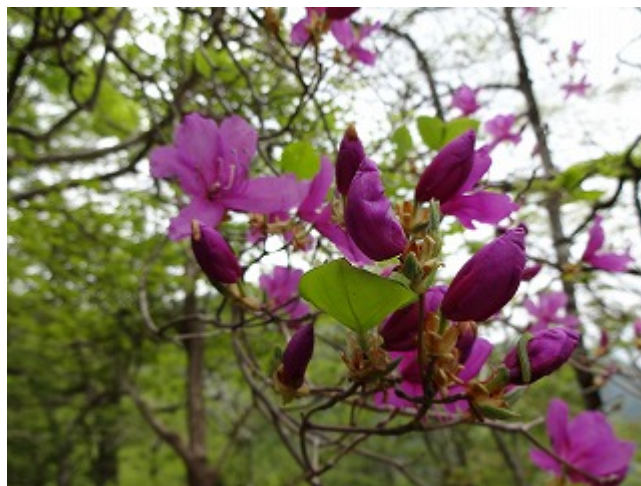
標高 1200m を超えた付近からトウゴクミツバツツジがやっと咲き始めていた。