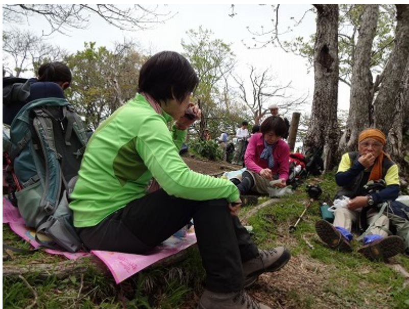
檜洞丸（1601）山頂に予定より 10 分 遅れで 12:50 に到着。 標高差 1051m をクリアーして遅い昼 食。