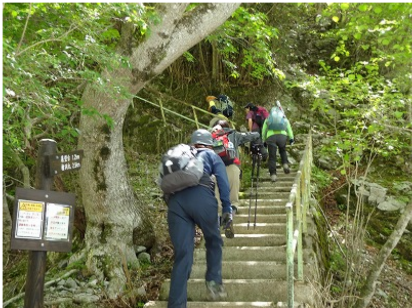
10:30 出発これから急登りが始まる。 最初は石段で。