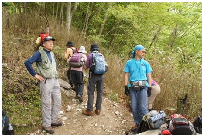
11:20 展望台に着く。標高 1120m で約半分の高度を稼いだが、残り 500m の高度を登必要がある。