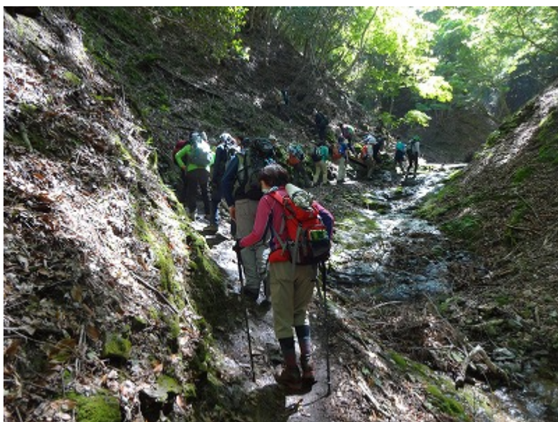
数珠つなぎに登山客が連なる。 このツツジの時期はこの山の人気が窺い知れる。細い沢状の登山道。