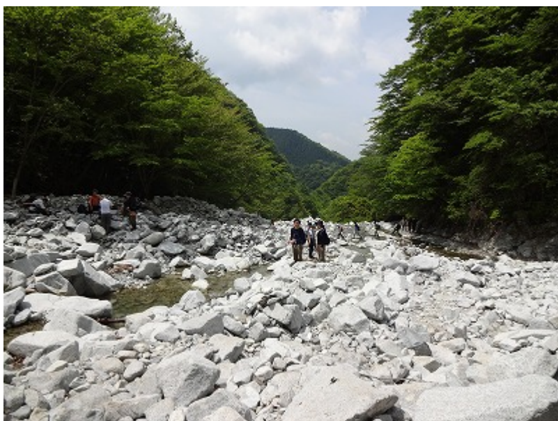
10:23 ゴラ沢の出合に到着。 標高 750m で 200m の高度を稼いだ。