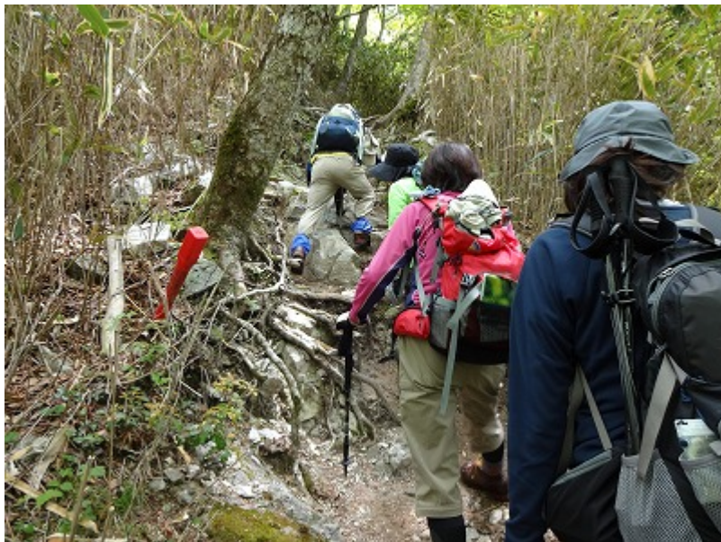
大きな石を超えて