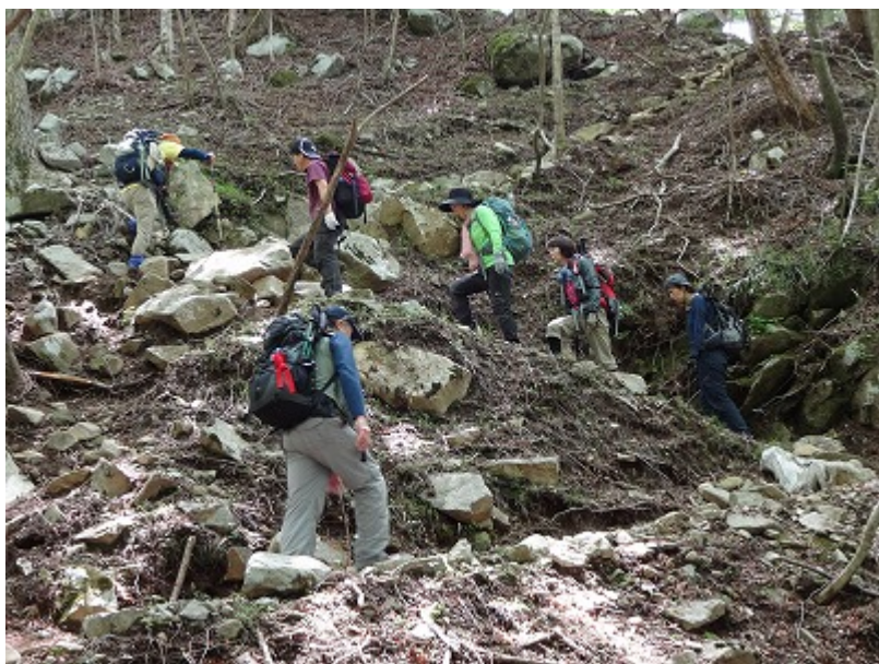
風がないので、もう背中汗でびっしり。 黙々と高度を稼ぐ。