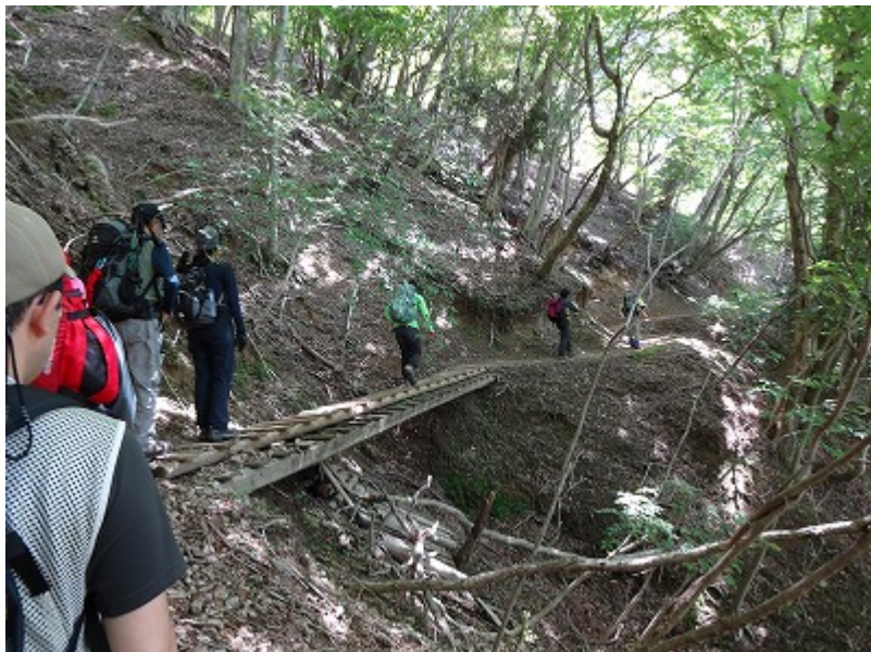
再び丸木で組んだ橋を渡る