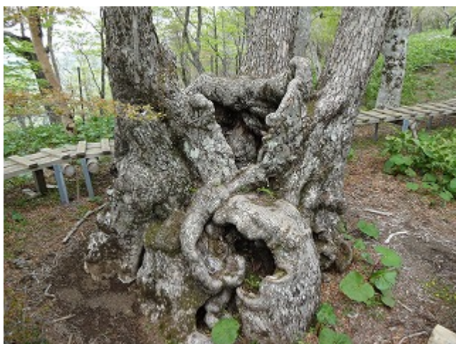
ブナの古木は直径 2 m 位ある。