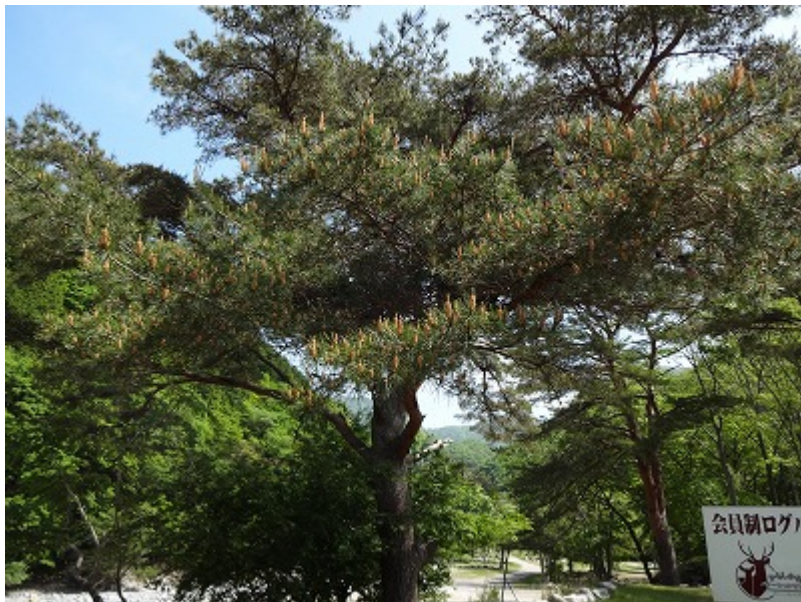
途中の大きな赤松