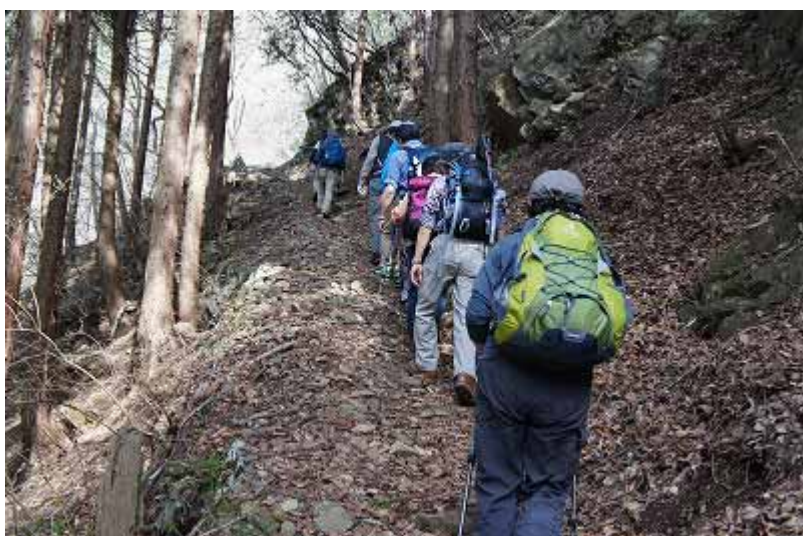
徐々に斜度がきつくなる