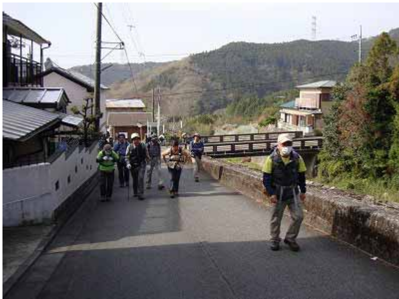
ヤビツ峠の標識に従って林道を進む。