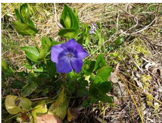
里山の春の花が出迎えてくれた。