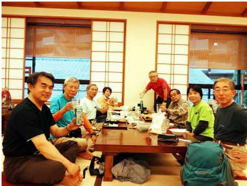
入浴後は大広間で宴会