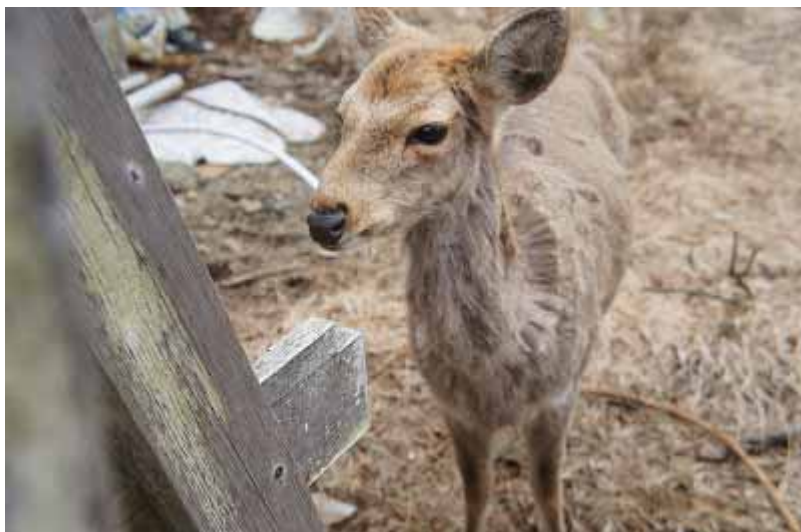
山頂の金網の向こうに野生の鹿