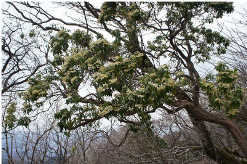
馬酔木の花が満開