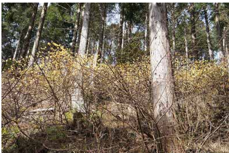
暫く登るとミツマタの群生地が現れた (9:30)