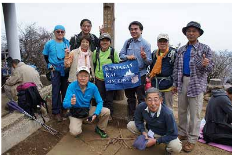
山頂標識を囲んで記念の集合写真