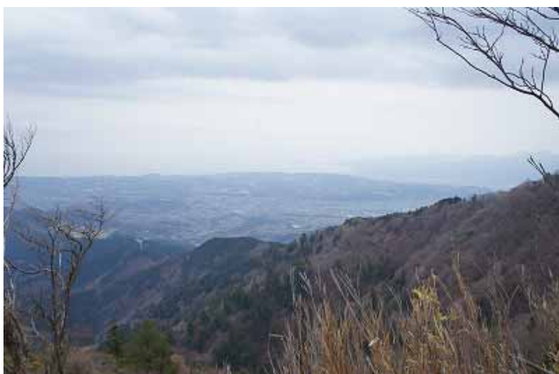
山頂からは相模湾、真鶴半島がかすんで見える。 12:35 下山に入る。