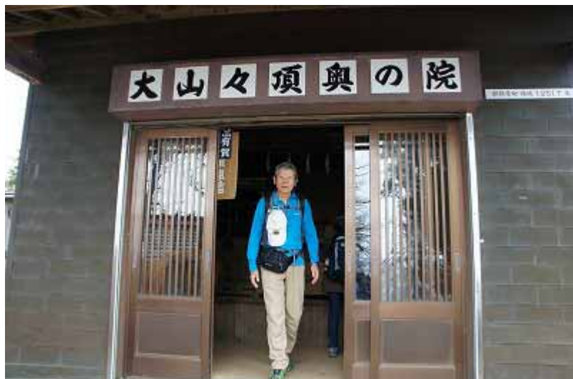
大山山頂奥の院で安全祈願