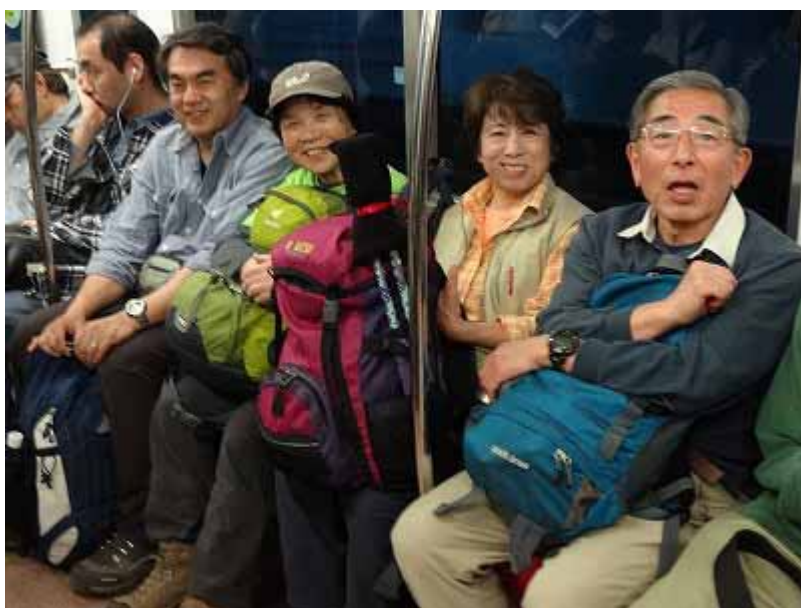
小田急で新宿へ向かうチーム お疲れ様でした。