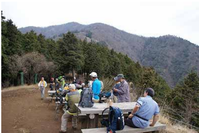
13:45 見晴台に到着。 背後の山から下ってきた。