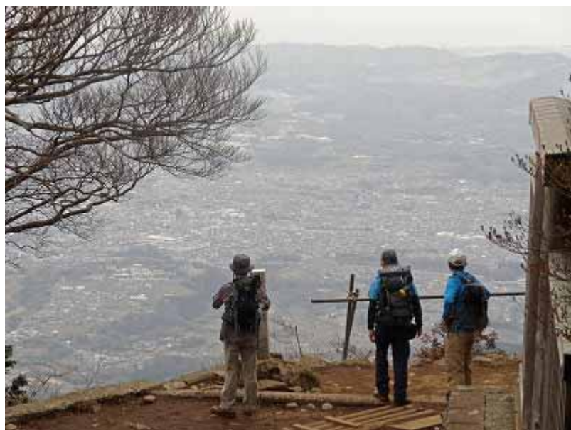
山頂から東方向の展望は素晴らしい