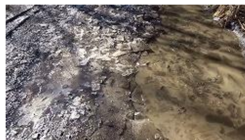
二俣で休憩の予定が、休まずに先に進む。(10 分でなく、20 分更に歩かされる) 水溜りは凍てた。