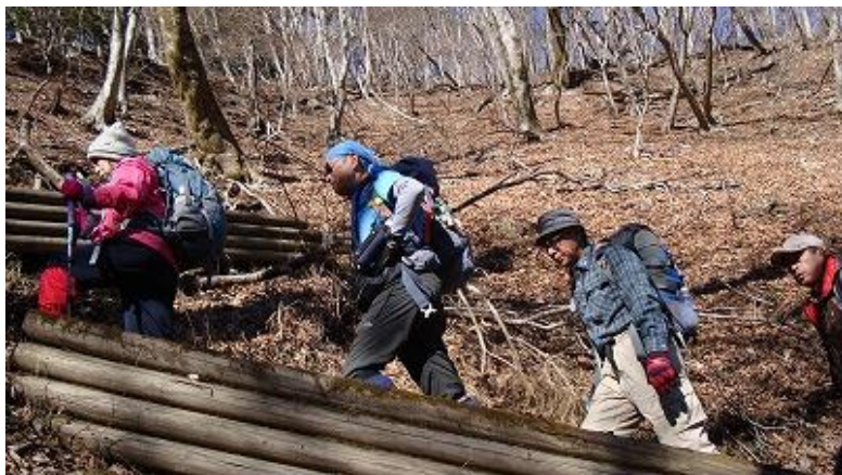
川島さんは快調なペースで登り続け、先頭で皆を引っ張る。