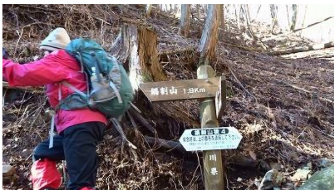
快調に登り「鍋割山稜4」を通過