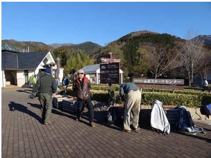
8:30 に大倉に到着、個々に準備体操で、 正月で鈍った体に喝をいれ目覚めさせる。