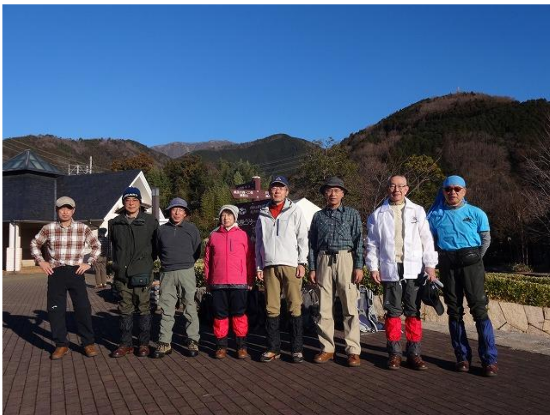
登山準備を整え、出発前に記念写真を撮る。