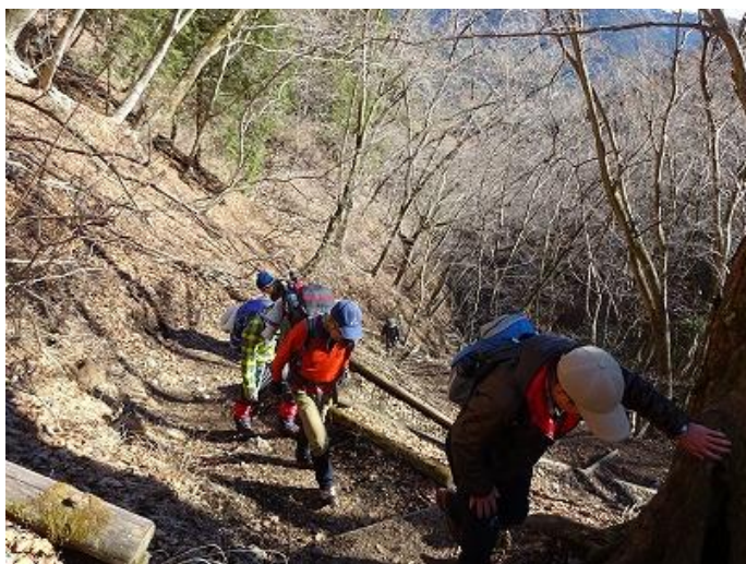
稜線（後沢乗越）に出るまでもう少しだ、頑張ろう。