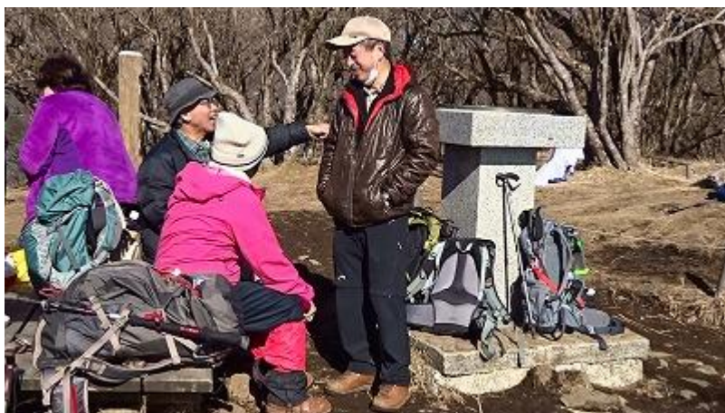
鍋焼うどんが出来る間、小休止。 風もなく、穏やかな日差しを浴びて暖かい。