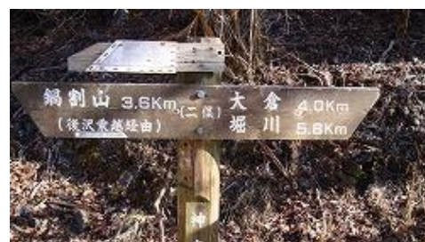
二俣に、ほぼ 10 時に到着する。