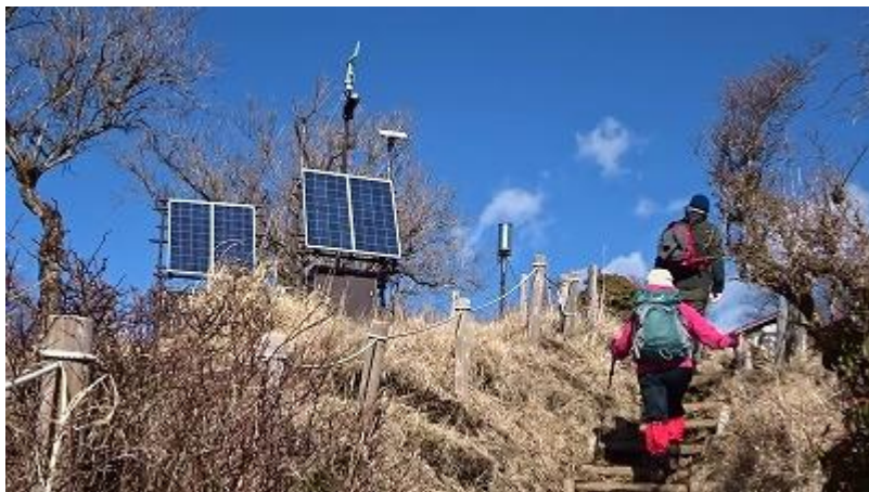
太陽パネルが見えればもう山頂だ。