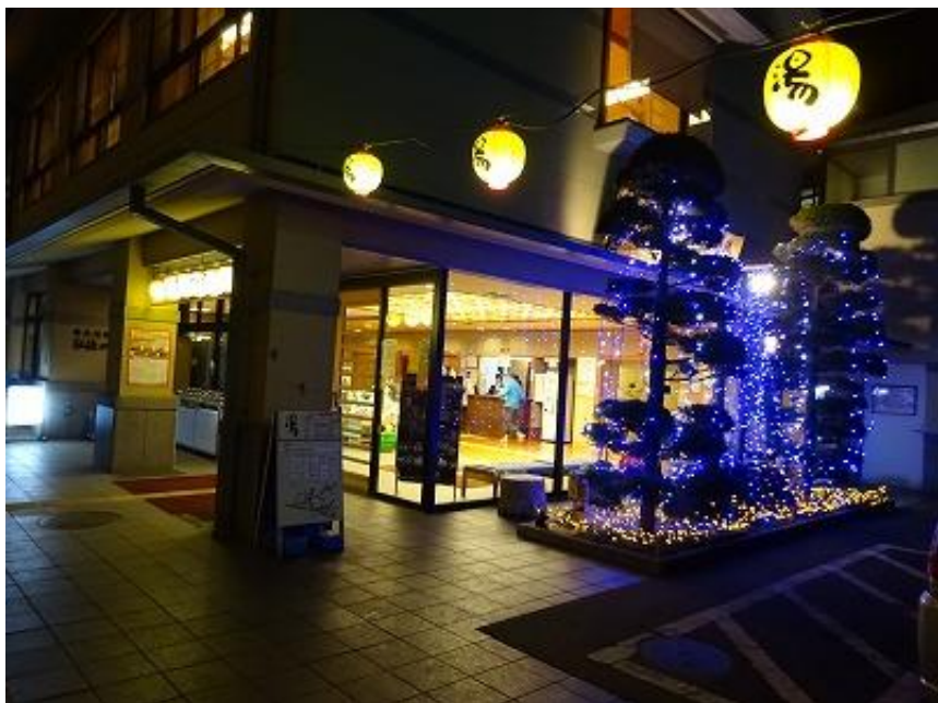
18:30 温泉を後にして、初登山を堪能して、今年もやるぞ！と元気が出て、帰路に着きました（本日は3万2000歩）