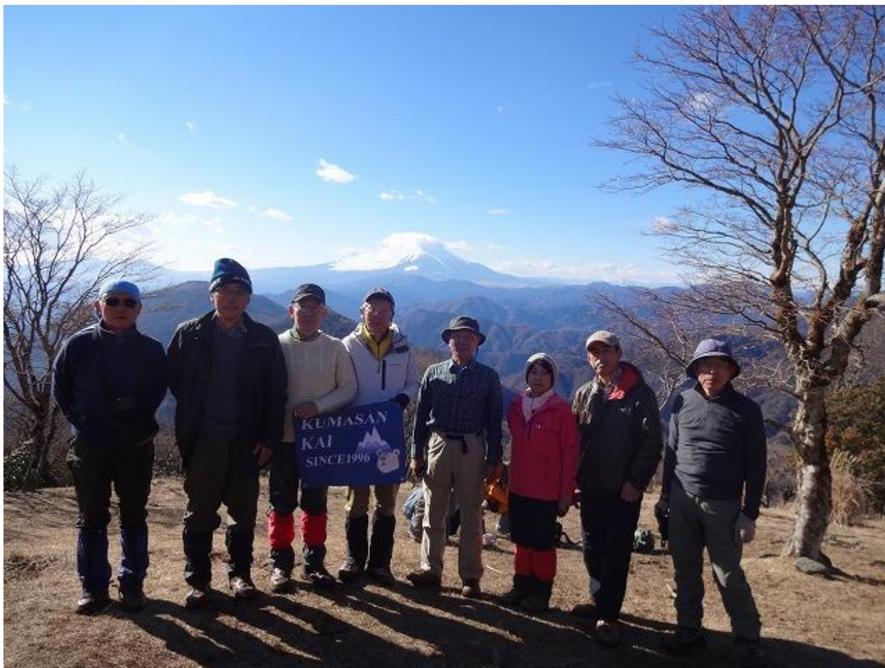
山頂で富士山を背景に記念写真