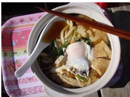
本日お待ちかねの名物、アツアツの「鍋焼うどん」