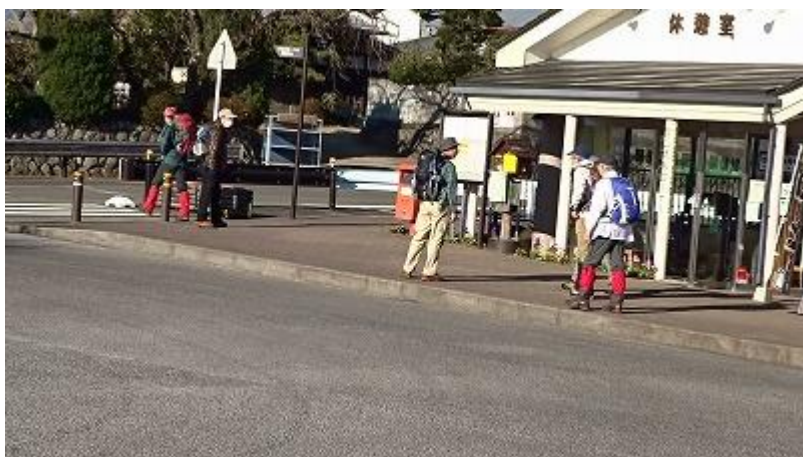
9:50 に大倉バス停を出発