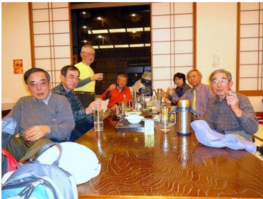
鶴巻温泉「弘法の里湯」で約1時間30分ノンビリ入浴休憩する。