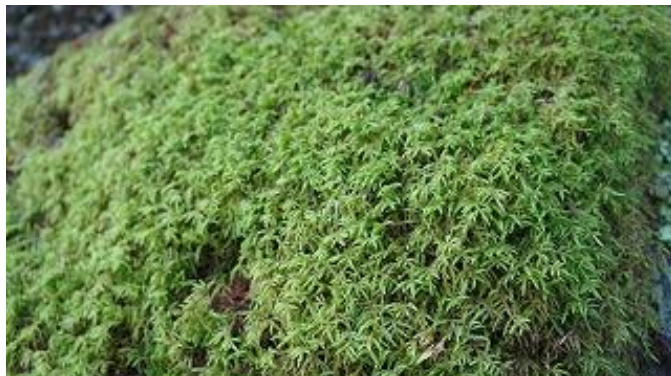
この辺りは苔が綺麗ですね