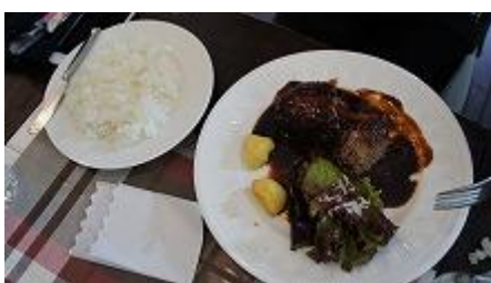
肉食系女子用・ハンバーグ