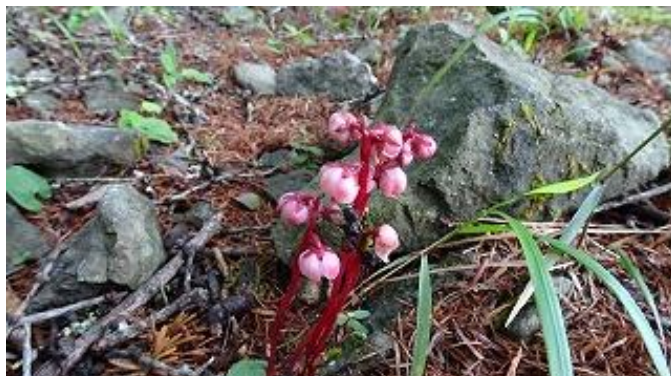
路傍に「ベニバナイチヤクソウ」？正解は判明せず