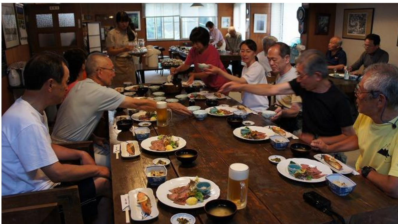
飲んで・食べて、明日の瑞牆山に向けて英気を養うぞ～！！