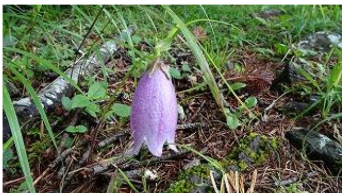
「ヤマホタルブクロ」発見