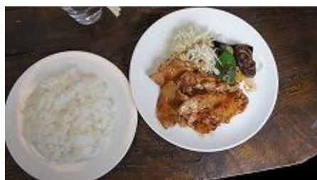
おじさんの生姜焼き

厨房から、「材料が揃わないので、バラばらに、いろいろ注文してくださいね～」とは面白い