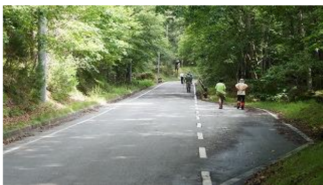
県道に出てしばらくすると左手に「瑞牆の森」があった。ここは全国植樹祭で出来たものらしい