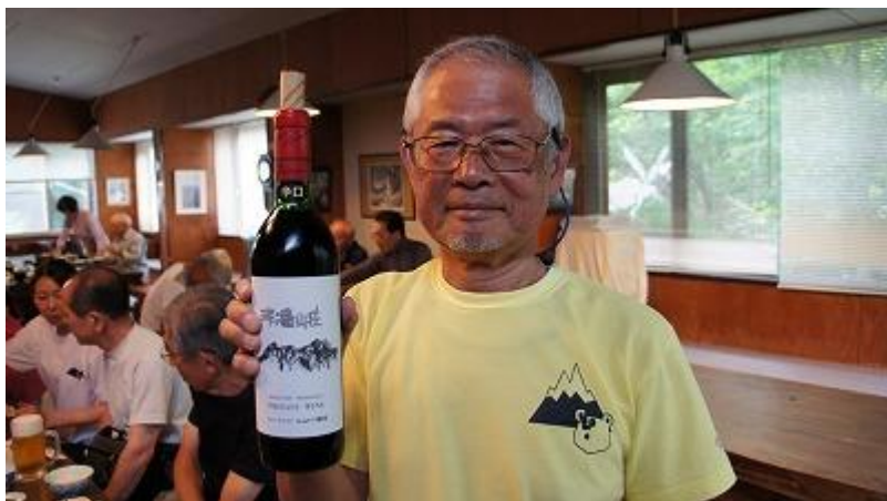
という事で、「ワインの熊本さん登場」