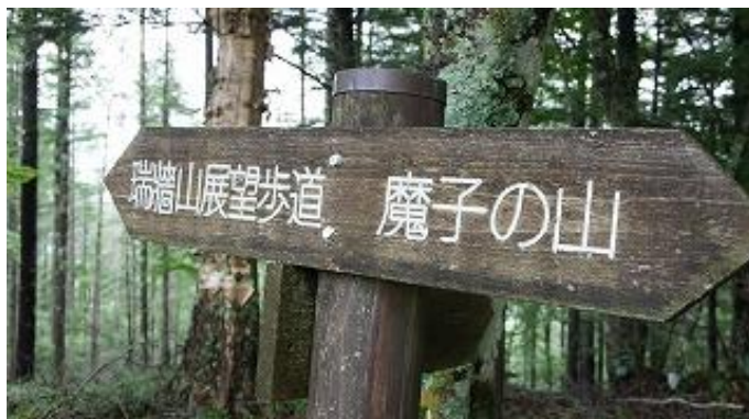
展望歩道の看板も