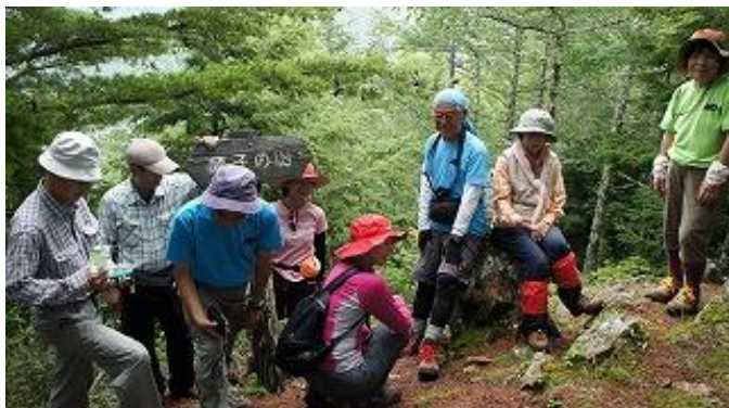
ピクニック的でくつろいでいます