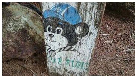
富士見平で見つけた看板「クマさんを大切に」？