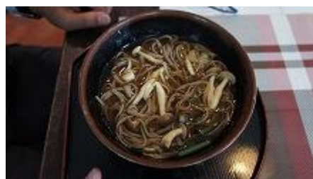
暖かい・山菜蕎麦