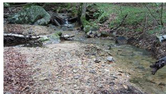
今回の山行きで沢を見たのは初めてで、伏流しているところが多いのではないと思われる