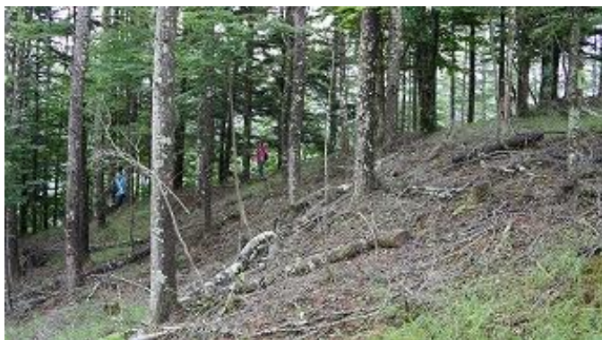
こうした山道を40分程下って、県道に到着した