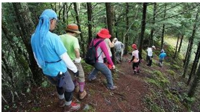
続いて展望台方向へ歩を進めました