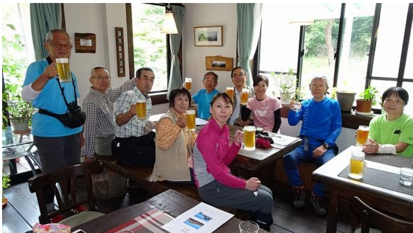
やっぱりクマさん会。まずはビールで乾杯だ！真夏のビールは浸みるのです

厨房から、「材料が揃わないので、バラばらに、いろいろ注文してくださいね～」とは面白い