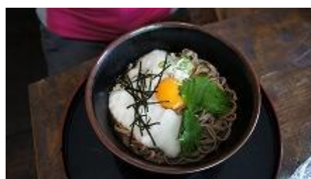
冷やし・とろろ蕎麦