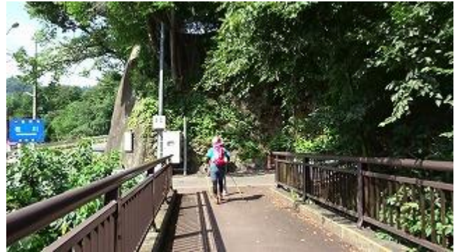
窪川から 20m 程進むと今度は清流が綺麗な大きな川が現れた。これぞ一級河川「桂川」だ。