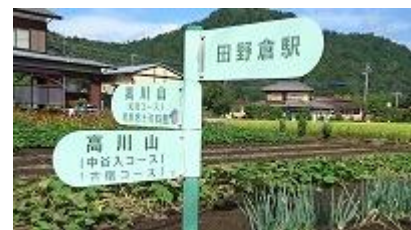
暫く進むと、本日初めての高川山への指示標識が現れ、ホットする。