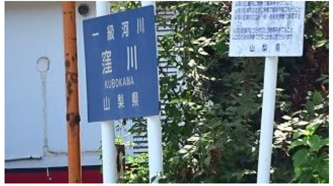
右折すると直ぐ小さな川幅 2、3m 程の川が現れた。何とこれが一級河川「窪川」だと・・・