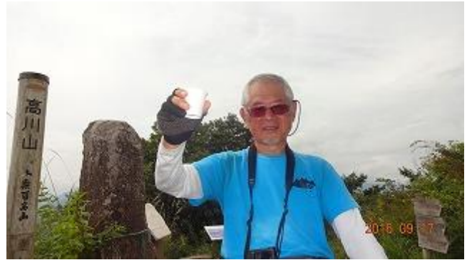
全員揃ったところで、膝痛復帰祝いと後期高齢者突入を嘆いて「乾杯！」