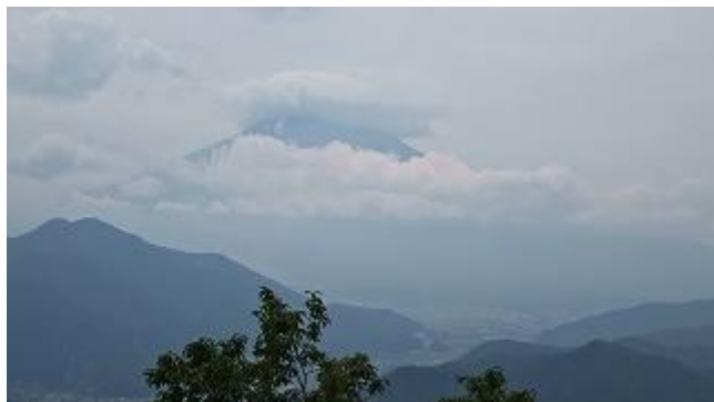
11:36 高川山山頂（976m）に到着。山頂には都立日野高校登山部のメンバーを中心に約 20 名位が清掃登山で登っていた。残念ながら富士山山頂には雲が被っていた。