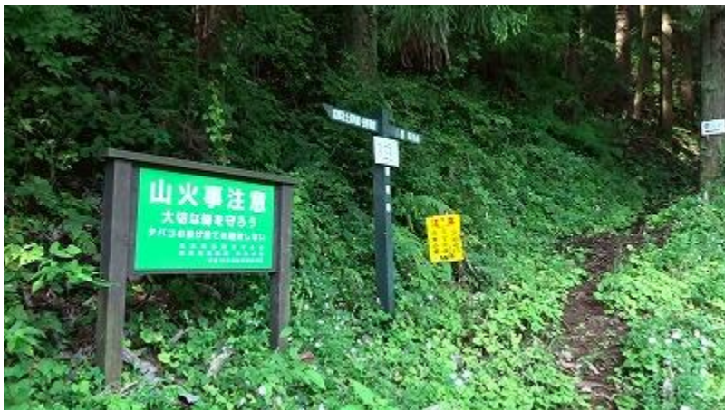
スタートして 30 分で松葉コース登山道口に到着した。(9:50)