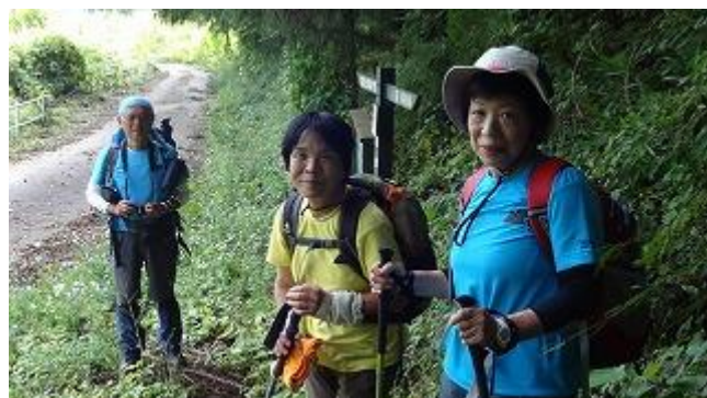
イヨイヨ、林道から狭い登山に入り、本格的な登山が始まる。