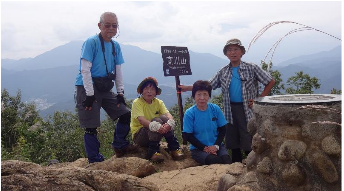
昼食後に登頂記念の集合写真。雲が無ければ下写真の様に富士山が・・・見えたのに残念！！