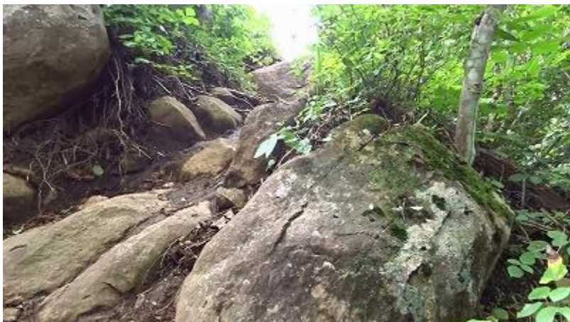
人の声が大きくなり、ここを登り切れば山頂のようだ。