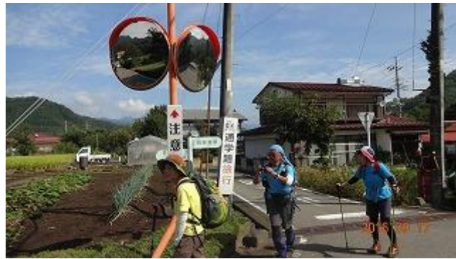
田野倉駅から歩くこと 15 分で道祖神があらわれ、そこを左折する。