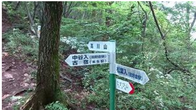
11:25 中谷入コース、禾生（かせい）駅からのコースとの合流・分岐点について。