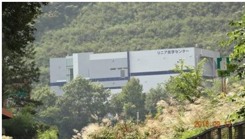
更にそのまま進むと県立リニア学習センターへ（左）の標識があり、その先に学習センターが中腹に見えた。我々は高川山へ直進する。