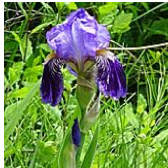
ジャーマンアイリス