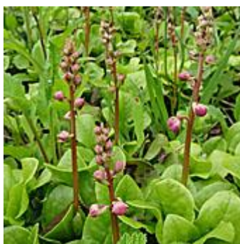
ベニバナイチヤクソウ