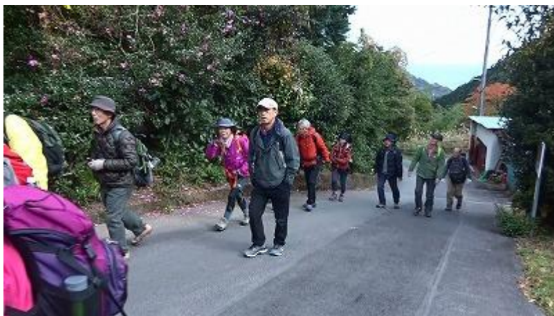
急な坂を登っていくと