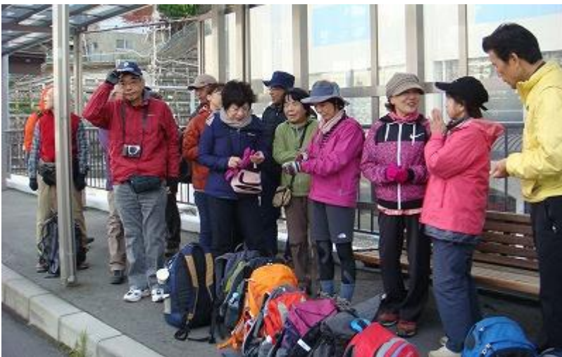
続々と到着し、バス乗り場③番に並ぶ。