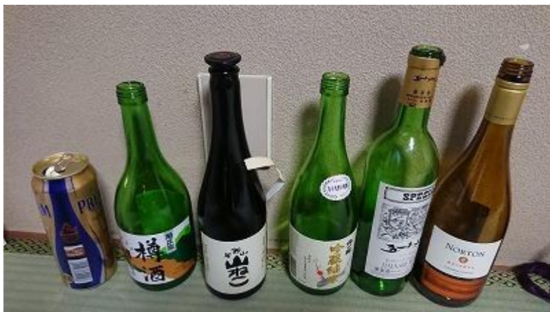
飲み終えたお酒の数々・・・