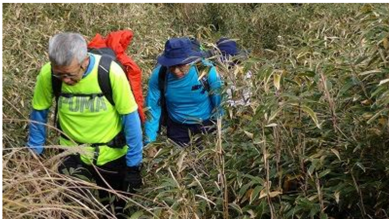
笹で覆われた急坂を登り切ると