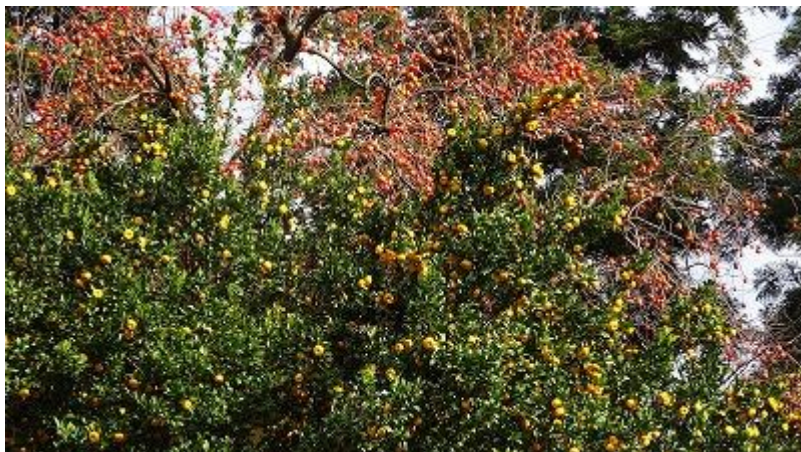
沿道の農家の庭先に巨大な柚子と豆柿？の木があった。