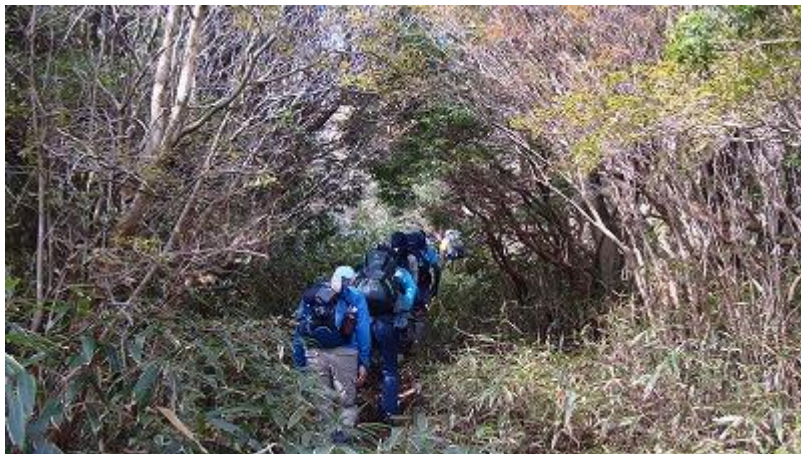
笹が生い茂っている道を進むと