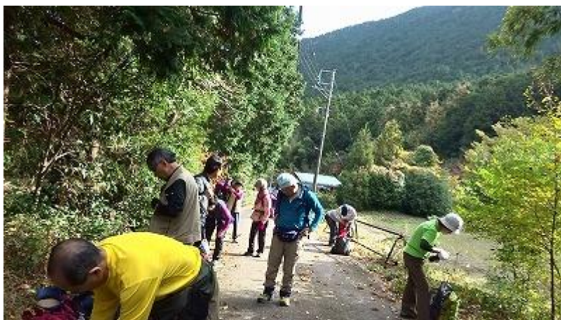
10:09 急坂を登ってきたので暑くなり、上着を脱ぐ。