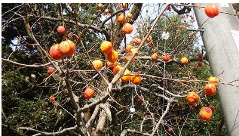
小ぶりの柿の木などもあり、落ちている(?)のを食べてみたら、甘いけれどちょっと渋かったそう。