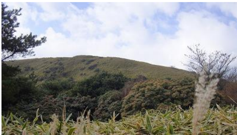
めざす玄岳の山頂も見えた。