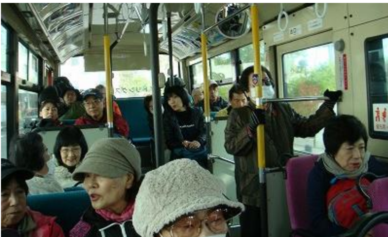
9:25 発のひばりヶ丘行きに乗り出発。