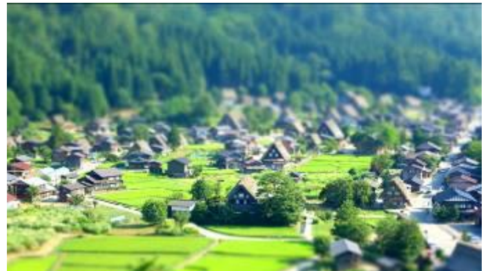
「であい橋」を渡ると合掌造り集落の萩町。さすがに観光客が多い。 県重文 明善寺・和田家をみながら展望台へ。萩町が一望できる。