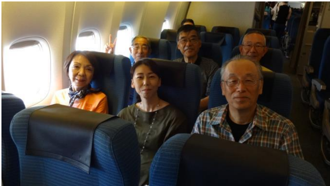
客室乗務員さんが親切に写真を撮ってくれた。