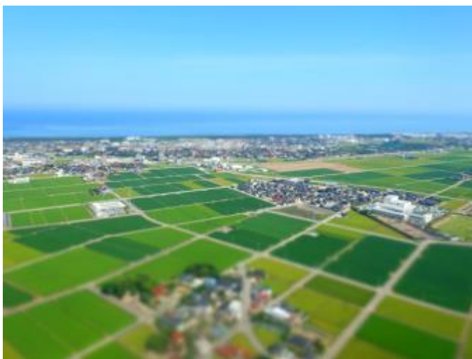
晴天で 白山登山が 楽しみです