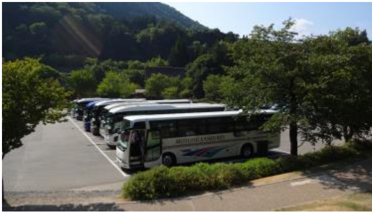
観光バスが沢山きている。