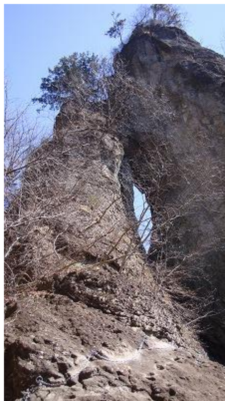
第一石門が現れた。下を歩くゴマ粒大の人と比較すると大きさが判る 右上の写真は第二石門だ