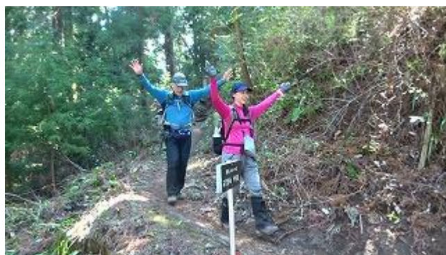
13:55・予定より早めに妙義神社に到着