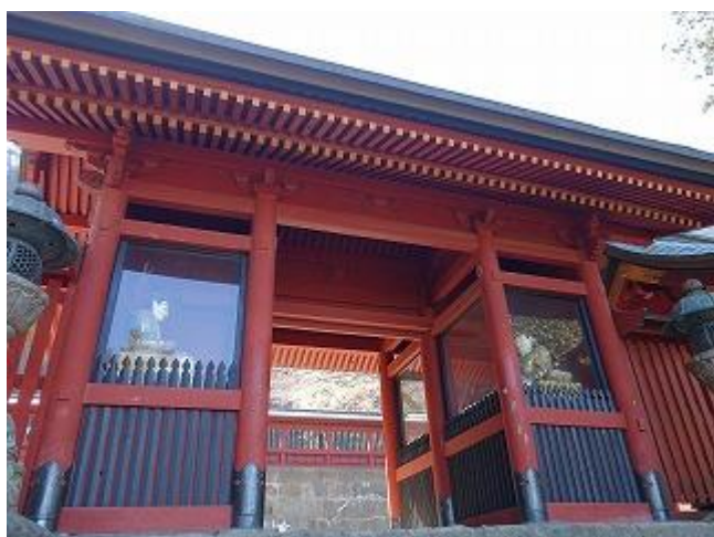
春があられる境内でお参りを済ませました