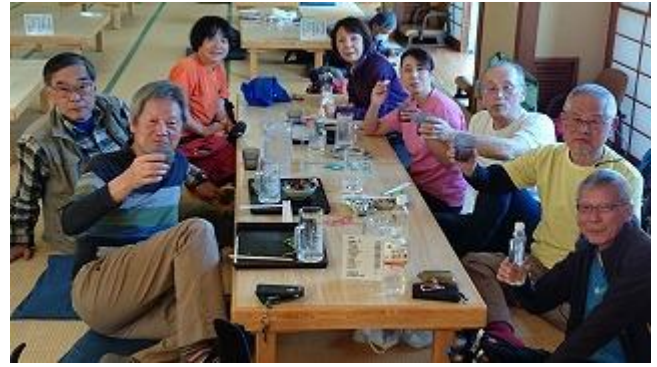
磯部駅前の「恵みの湯」で、たっぷり・ゆったりの入浴休憩&乾杯タイムとなりました