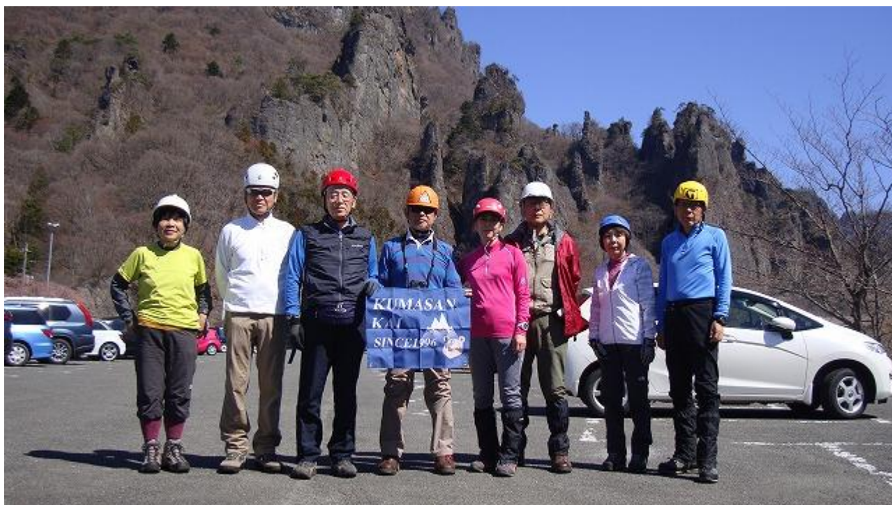
中ノ嶽神社駐車場で記念撮影のヘルメット軍団。登山道の工事に向かう猛者も？