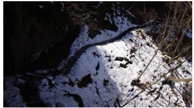
更に雪まで出てきた