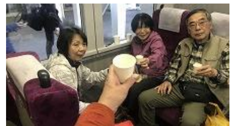
残りの「おじさん・おねえさん」達は、上野東京ライン各停のグリーン車で「どろドロ宴会」