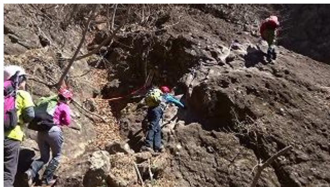
第一石門を潜り抜けて第二石門に近付くと、「かにのよこばい」登場