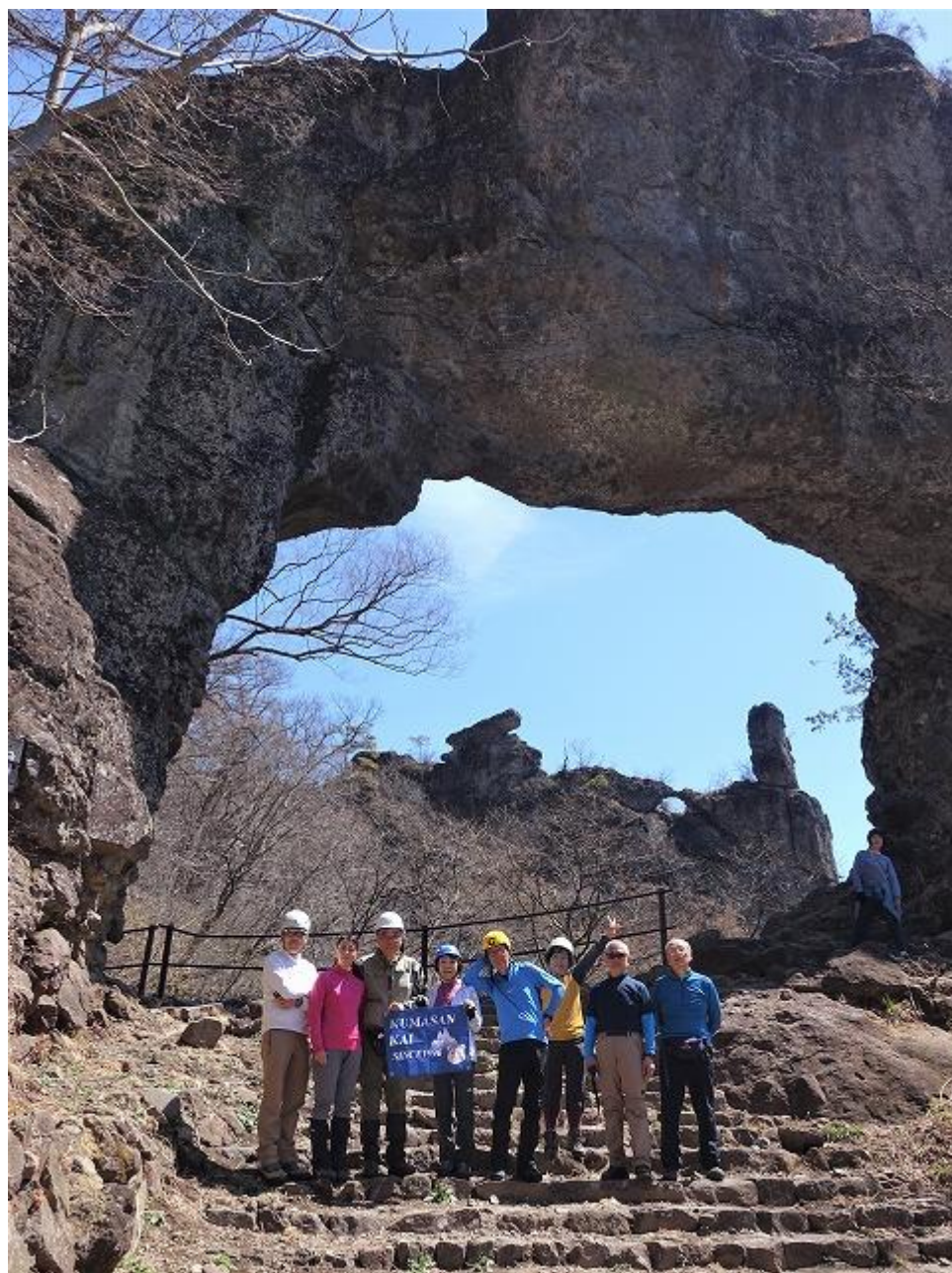
第四石門・正面中央奥の横向きの筒状のものが「大砲岩」だ。その右が「ゆるぎ岩？」