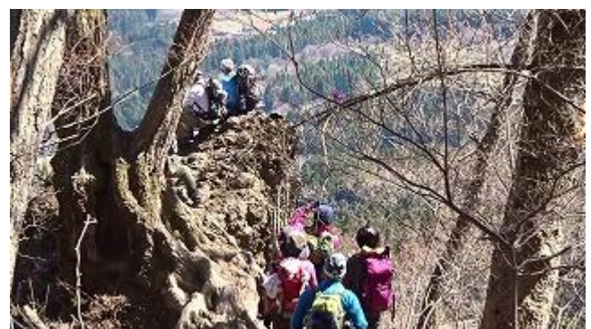
第二見晴らしにて：ここの眺めは良かった