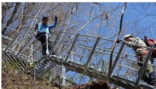
ラストは崩落地の急階段にいじめられたりしながらも