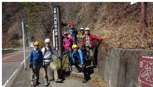
400mほど歩くと石門登山口に到着