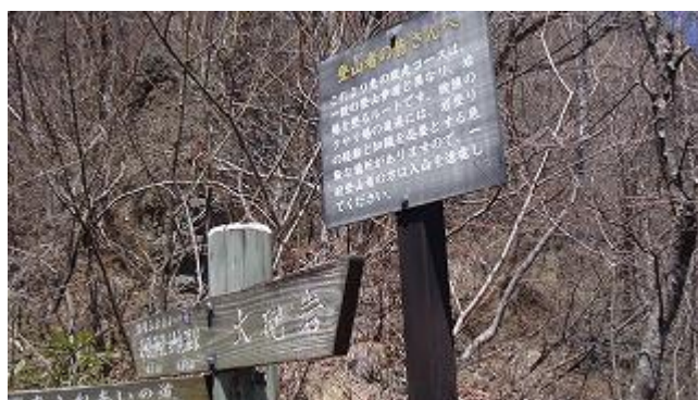
名物の鎖場がひと段落すると、石門広場に出たので小休止