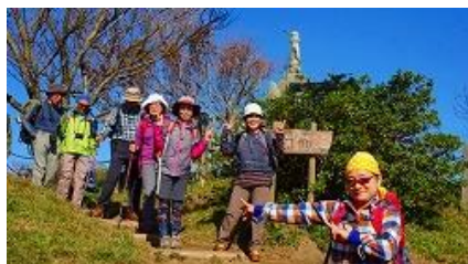
頂上に別れを告げ