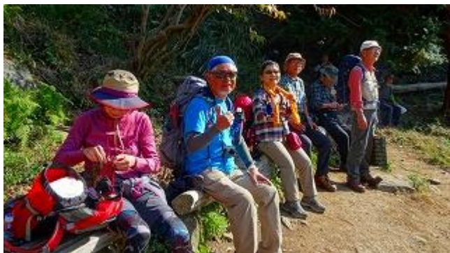
ニコニコ岩そばで休憩