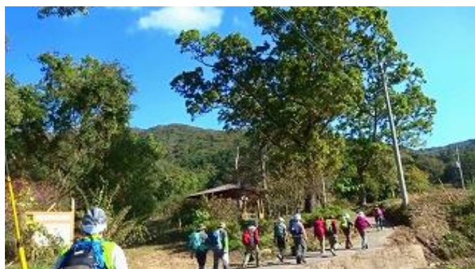
気持ちよい秋空の下宝篋山へ