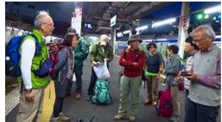
ホームでの電車待ちで歓談