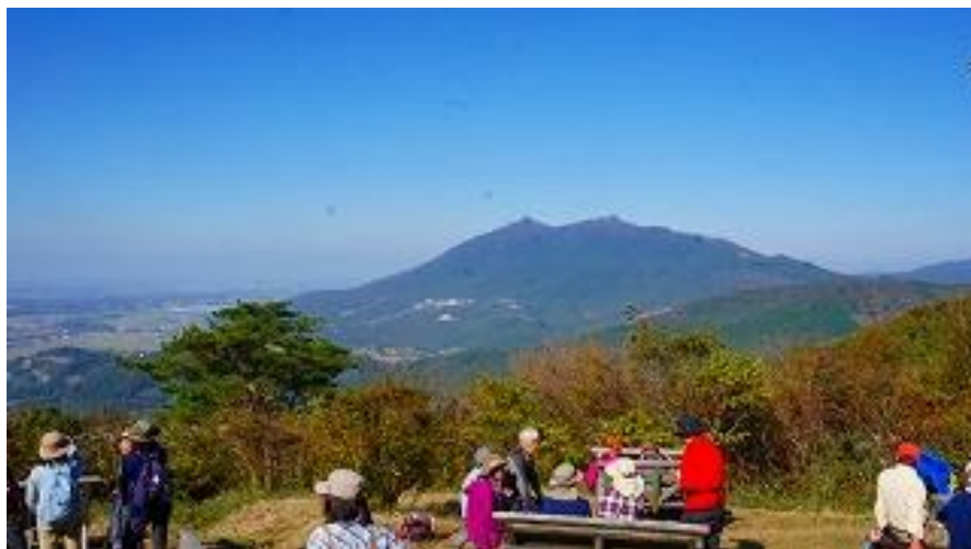
頂上から見た、筑波山、ベンチ多数あり、さあ！鍋パーティー