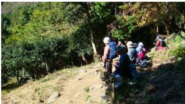
登り始めて、はじめて見える景色が良いねと！