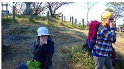
きのこ汁のきのこが、なな！なんと！半分のこっていた！（笑い）