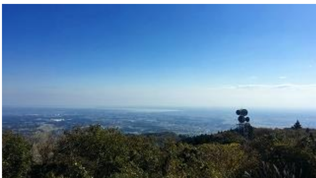
筑波山とは反対方向の眺望