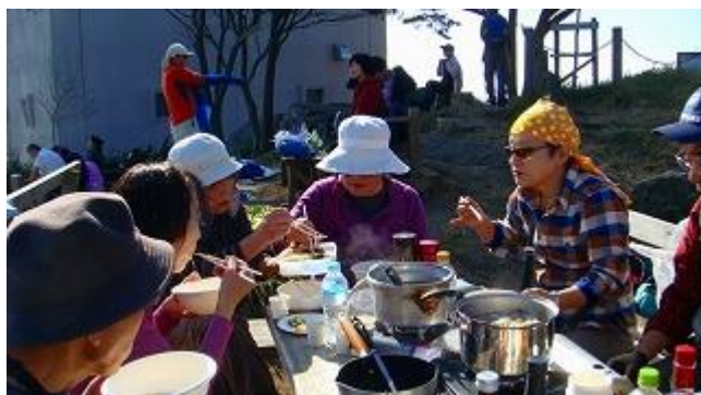
戴きます！鍋は良く出汁のでた美味しいきのこスープ、うどんを入れて更におなかいっぱい！