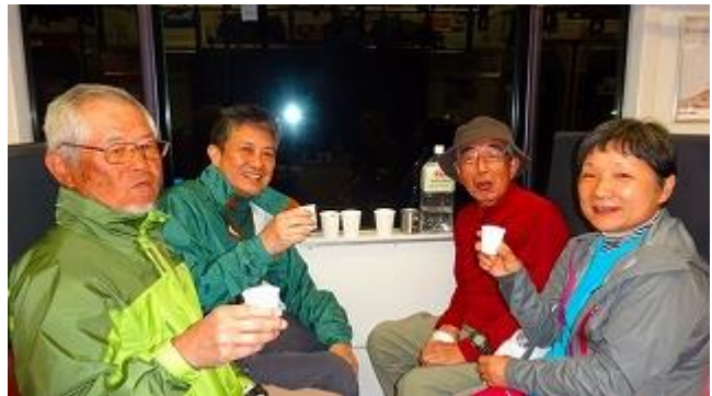
上野東京ライン常磐線に乗車、車内宴会です。