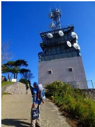
頂上にある、中継局？