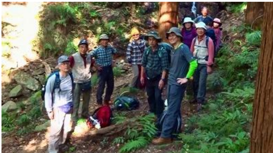
沢沿いの木陰で途中一休み