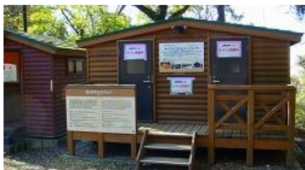
登りきったところにある、頂上下のトイレ