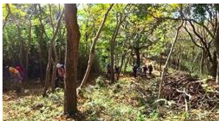
傾斜がきつくなって来ました