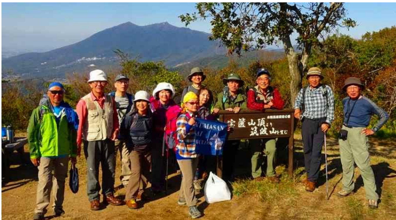
筑波山をバックに、宝篋山頂でクマさん旗と共に記念撮影。