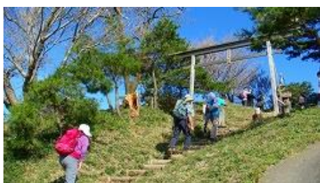
頂上は更に上でしたが、到着です、