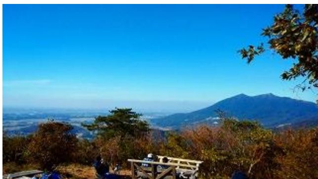
頂上からの眺め筑波山方向