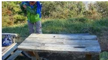
終わった後のベンチ、後を濁さず！