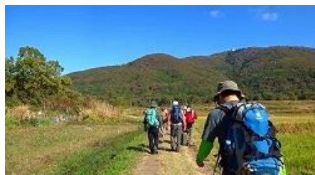
案内板に従って極楽寺コースを行います。 右に水田、米が実っています。 前方に宝篋山です。