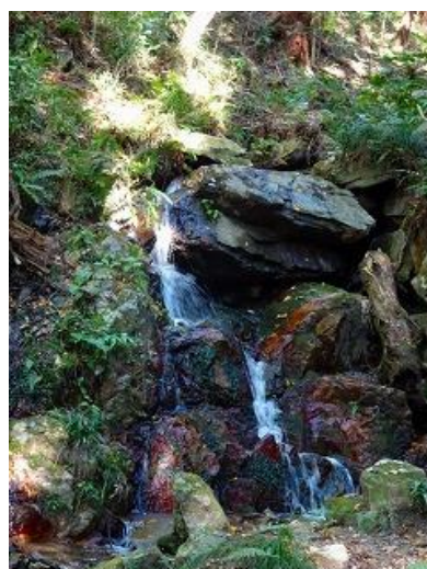
風情のある見事な滝