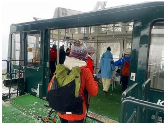
ロープウェイ。100人乗り 14:10