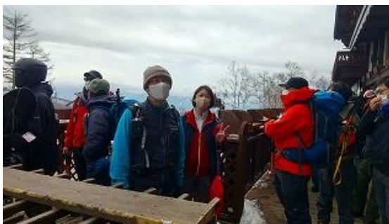
ロープウェイ乗車順番待ち