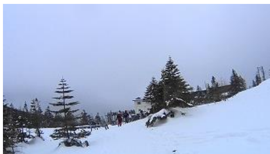
ロープウェイ山頂駅に到着 14:01