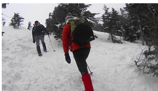
北横ヒュッテを後に頂上前の急登を上る二人 13:07