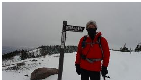
南峰到着、非常に強い強風、寒いので人はあまりいない。13:17