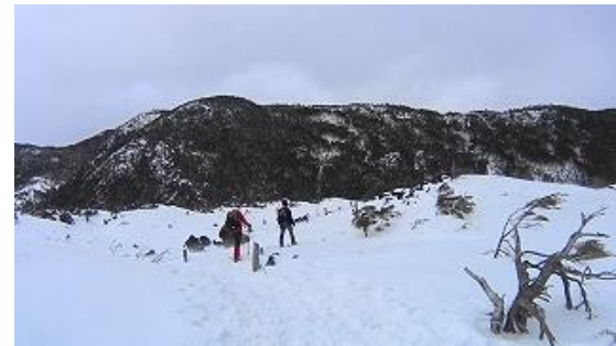
坪庭看板の先の北横岳ガイド、登山開始 12:11 頂上を目指し軽快に歩く二人 12:18