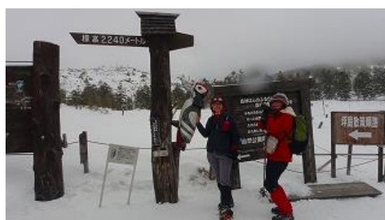
山頂駅手前にあるキツツキの看板前で記念撮影、キツツキ大きいです！ 14:04