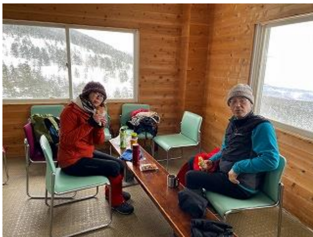
ロープウェイ頂上待合室にて昼食をとる。11:43