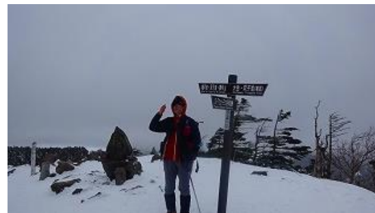
北峰から諏訪方面が一瞬垣間見えた、風は強い 13:23