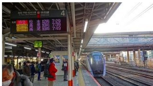
八王子からあずさ 1 号に乗車

現地アクセスは、あずさ 1 号新宿から服部さん、八王子から、中島さん、池戸、7 : 29 分発 今回はバス便が不便のため、昨年に引き続きレンタカーで行く事にしました。。