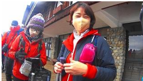
ロープウェイ乗車順番待ち 11:06