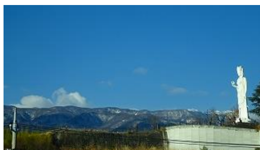
韮崎駅から甲斐駒方面