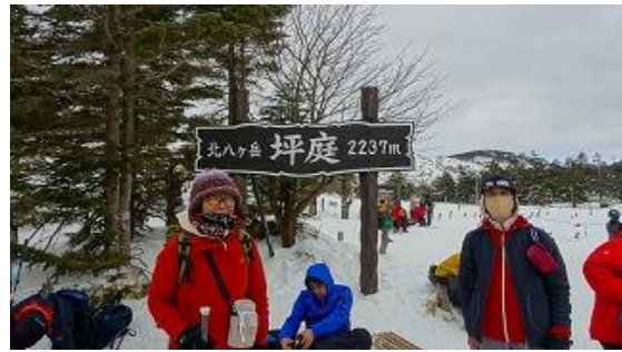
頂上駅から出ると坪庭の看板がある、記念撮影 12:09