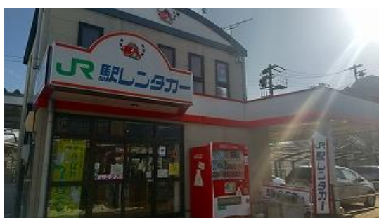
茅野駅レンタカー受付 9:20