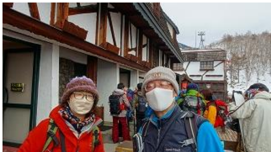
ロープウェイ順番待ち。後方が乗車場所