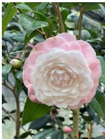
ヌチオズ・パール