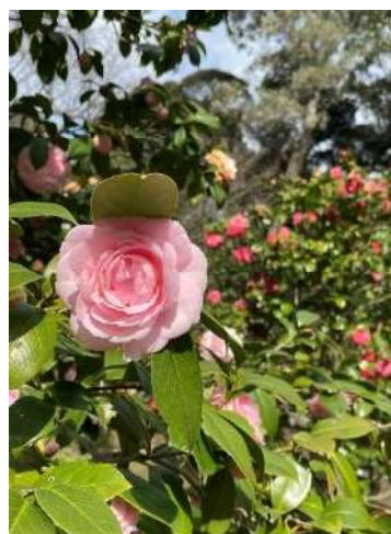
ハッピー・ホリデイズ