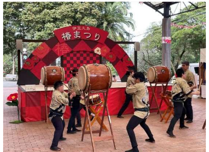
14:00 メイン会場では御神火太鼓のパフォーマンス