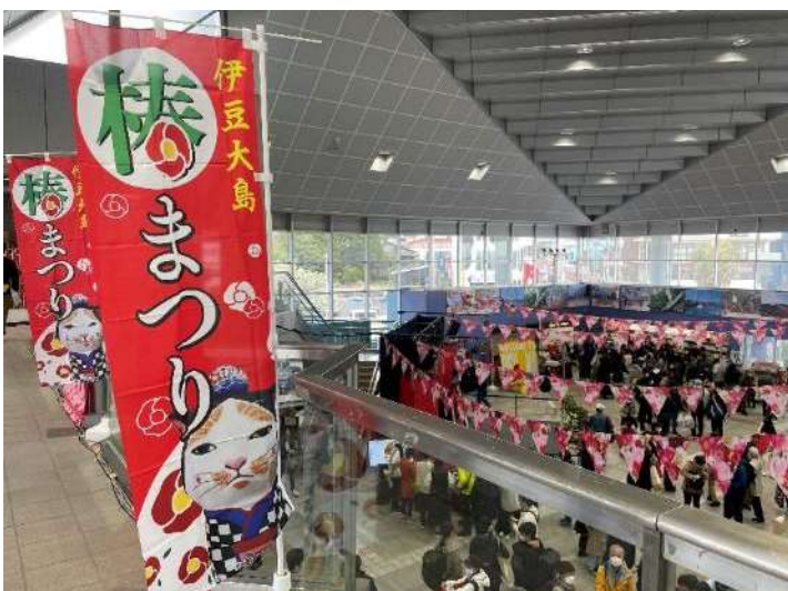
14:50 元町港は帰船する人で大混雑でした。