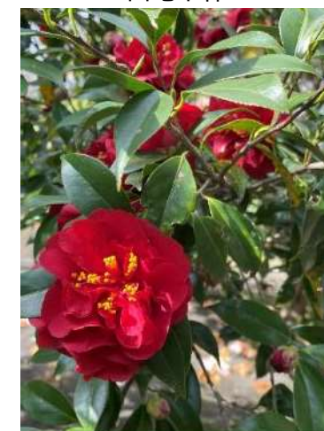
マリーン・アンド・ゴールド