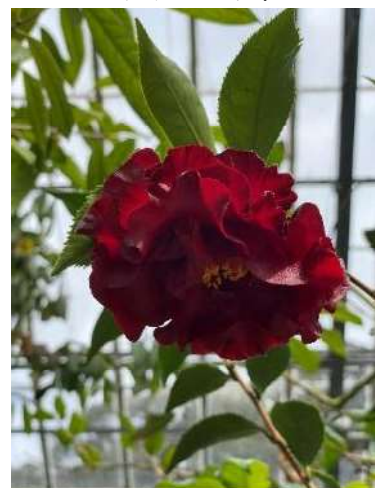
ブラック・マジック