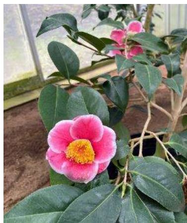
タマビューティー