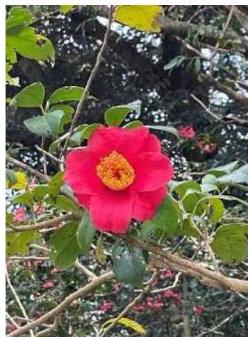
ハート・オー・ゴールド