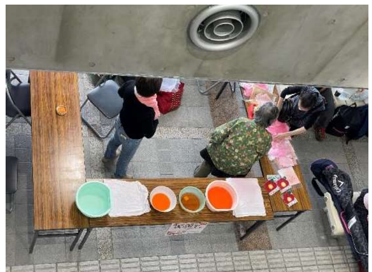
椿の花びら染め体験教室の先生親子 染料がかなり薄くなっています。