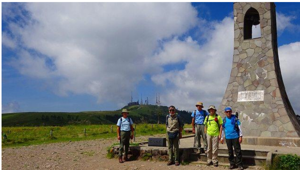
美しの塔の前で記念写真を撮る 11:02