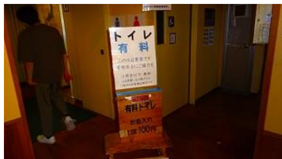
トイレは有料で利用できます