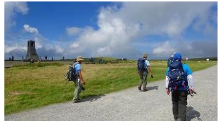
美しの塔が見える所まで戻って来ました 13:27