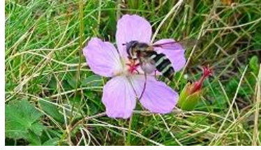
フウロに停まるハチ