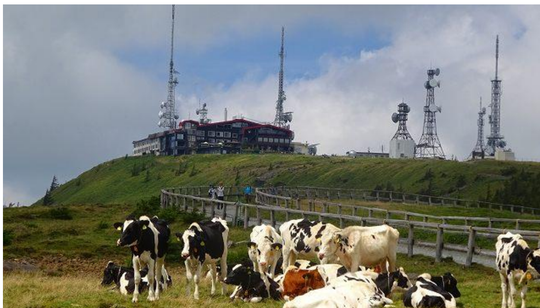
牛とホテルと電波塔、これから向かう先