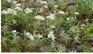
ヤマハハコの群生