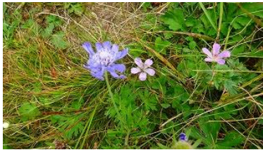
マツムシソウとフウロ