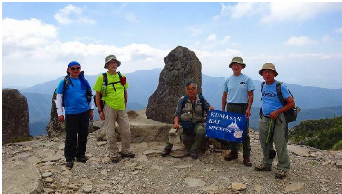
昼食後、ホテルの後ろにある王ヶ頭、美ヶ原頂上2034m 12:16