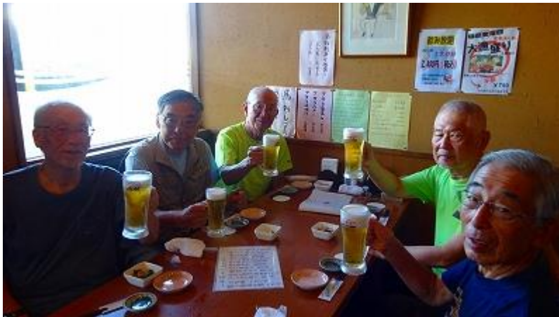
茅野駅前の居酒屋で無事帰還を祝し念願の馬刺し真澄を注文、恒例の祝宴と成った