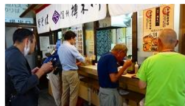
帰りに駅そばを食べて帰りました

お風呂は、諏訪市福祉センターの「いきいき元気館」¥310で温泉でシャンプーボデーシャンプー付き、で大変良かった。