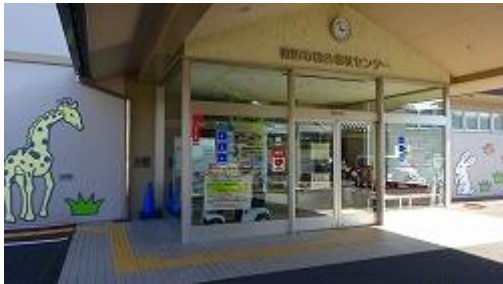
帰りにいきいき元気館、で入浴