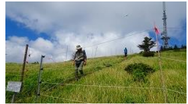
アルプス展望コース