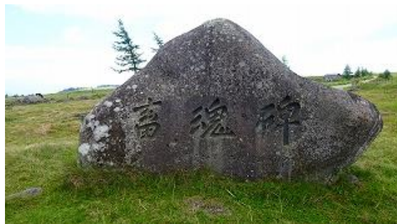
牛の冥福を祈る石碑？