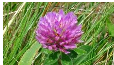
ムラサキツメクサ