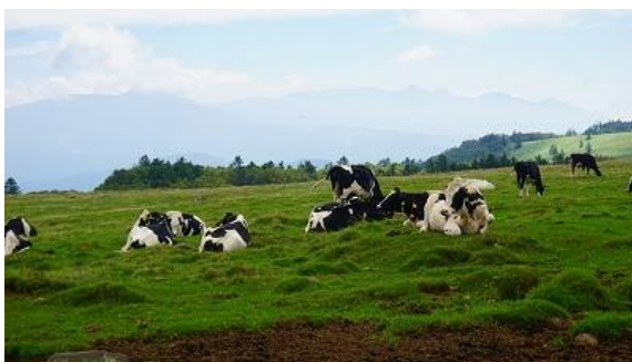
牛も熱いのか、地面が心地よいのか？