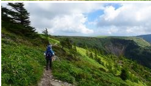
アルプス展望コースを行く