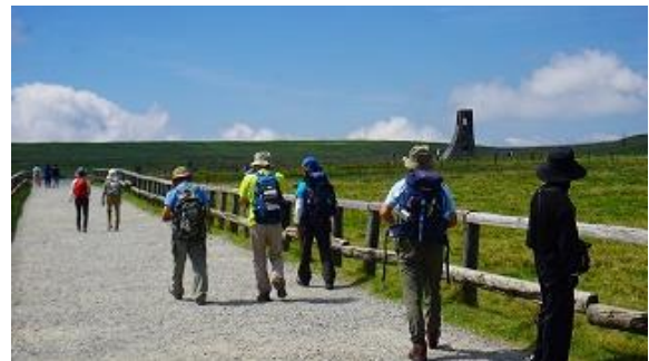
美しの塔へ向かう 10:56