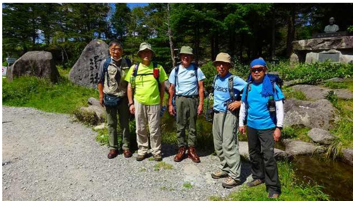
ふるさと館、駐車場前の石碑前で出発前の集合写真 10:44