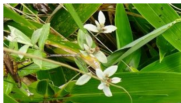
ミヤマウスユキソウ