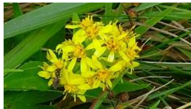
アキノキリンソウ