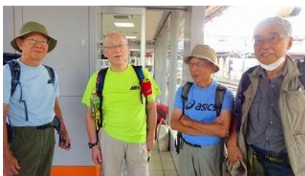
全員八王子 駅に集合