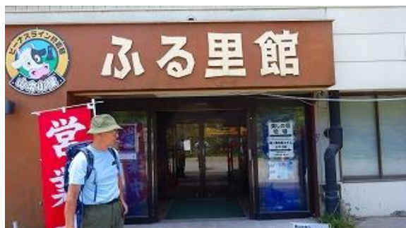
ふるさと館の駐車場に止める

歩程：山本小屋ふるさと館からパノラマコースを王ヶ頭まで行きアルプス展望コースで折り返し駐車場まで戻った。