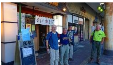
居酒屋前 大満足であつた。