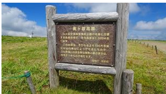
美ヶ原の説明看板