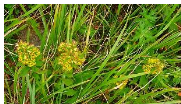
アキノキリンソウ