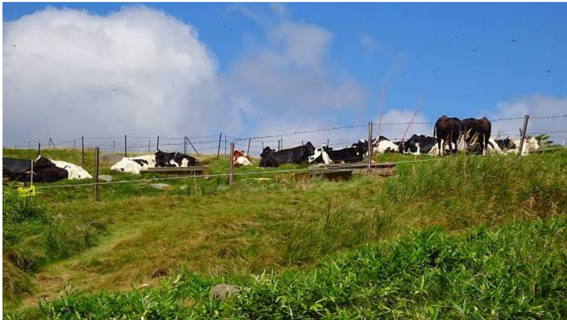
出発後、すぐに牧場の牛がのんびりとしている場所に遭遇 10:46